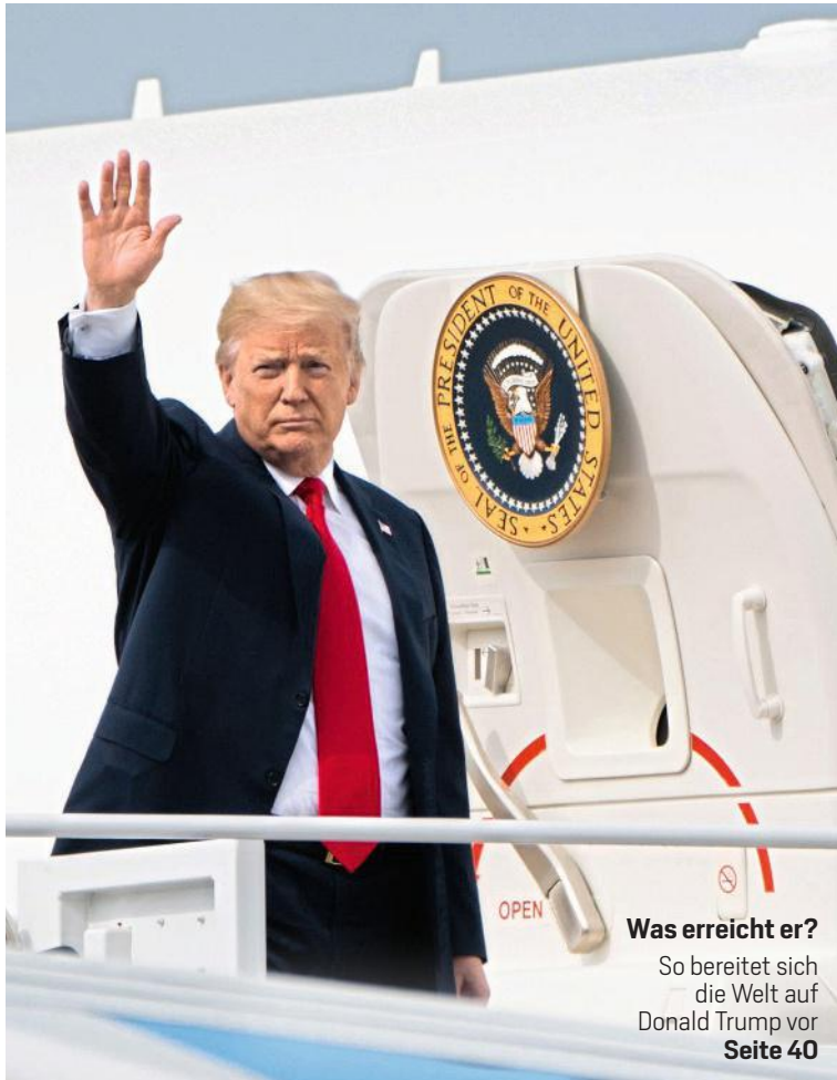
Was erreicht er? So bereitet sich die Welt auf Donald Trump vor Seite 40