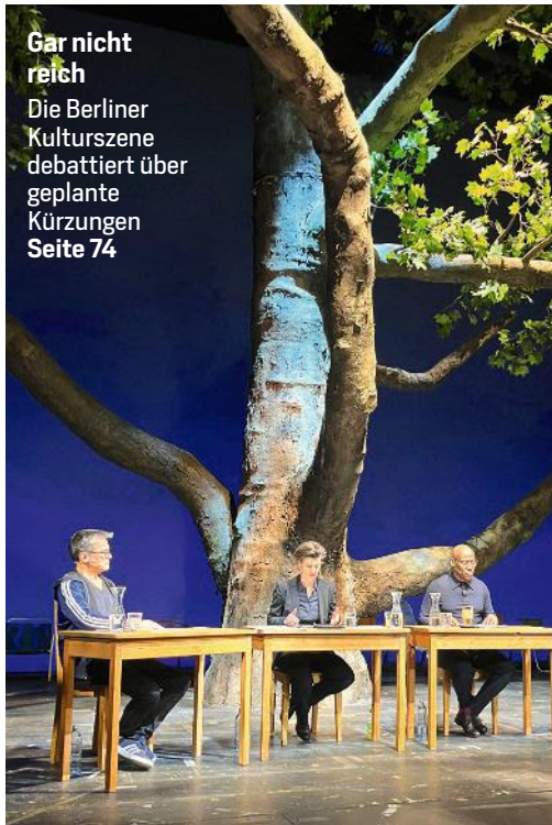
Gar nicht reich Die Berliner Kulturszene debattiert über geplante Kürzungen Seite 74