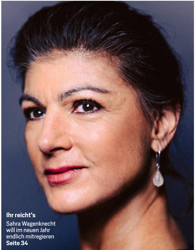
Ihr reicht's Sahra Wagenknecht will im neuen Jahr endlich mitregieren Seite 34