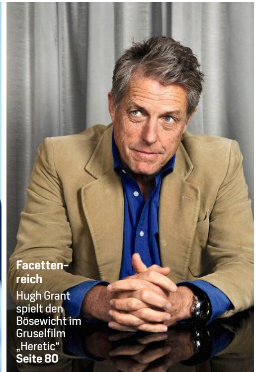
Facettenreich Hugh Grant spielt den Bösewicht im Gruselfilm „Heretic“ Seite 80