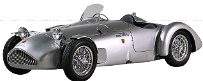
Reich an PS Damals wie heute: Abarth steht für Leistung Seite 100