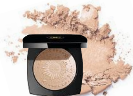
Wie das schimmert! „Diamond Dust Oversize Illuminating Powder“ von CHANEL, um 85 €