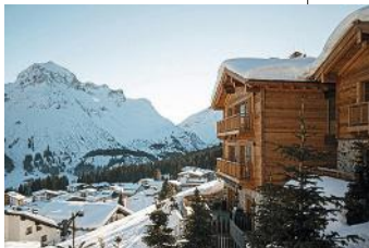
Winter-Wunder-Ort: das private Chalet THE BARN in Lech mit Platz für bis zu 14 Gäste. P. a. A., peppercollection.com