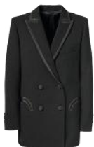
Klassiker mit Glam: Blazer mit Seidenpaspelierung, von BLAZÉ MILANO, um 1780 €