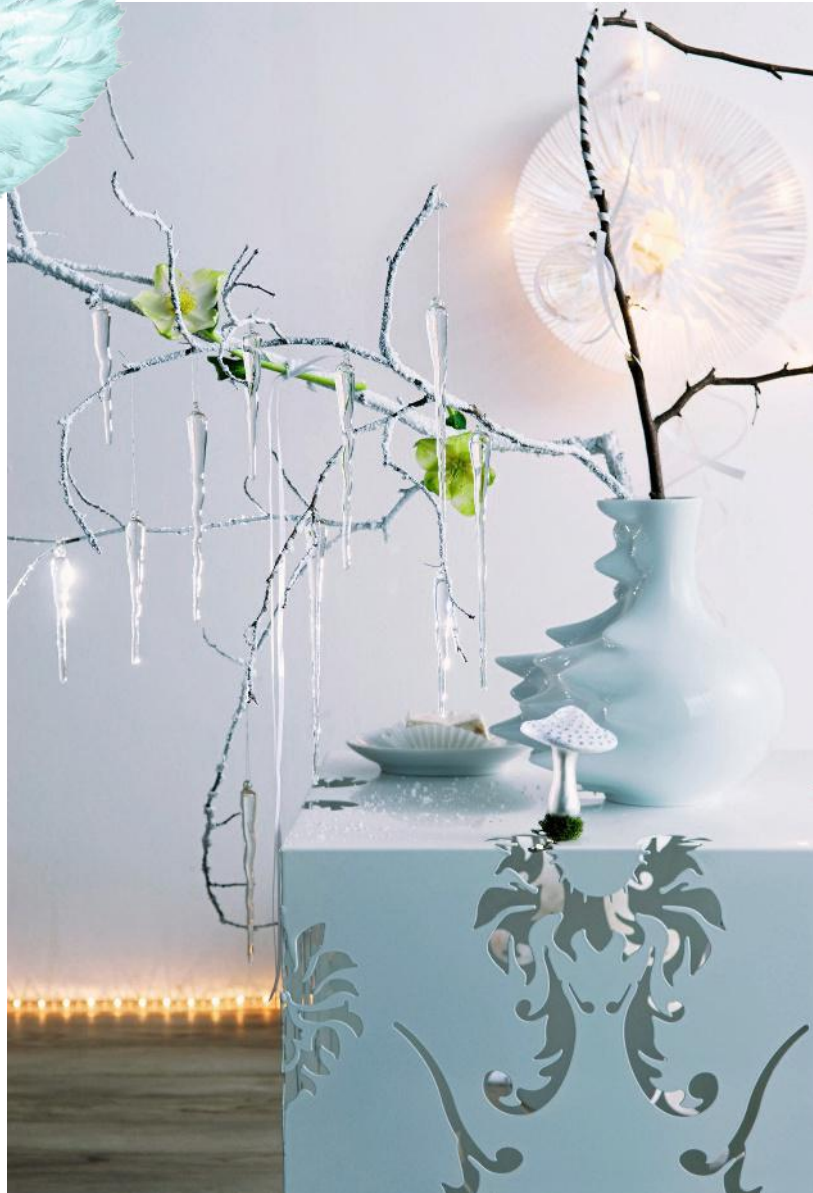
Redaktion u. Text: Nina Bemmam

► MIT TIEFENEFFEKT Der feingewebte Teppich „Treviso“ im Farbton Aqua vereint eine Vielfalt an Blautönen. Polyester, 170 x 240 cm, ca. 529 € (kibek.de)