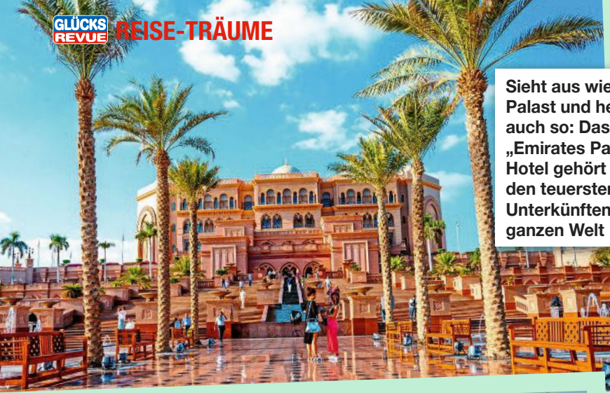
Sieht aus wie ein Palast und heißt auch so: Das „Emirates Palace“ Hotel gehört zu den teuersten Unterkünften der ganzen Welt