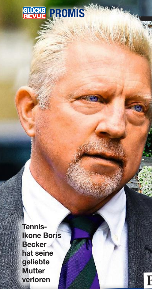
Tennis-ikone Boris Becker hat seine geliebte Mutter verloren