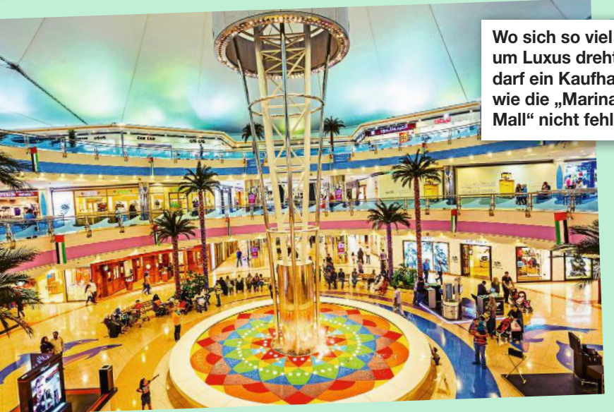
Wo sich so viel um Luxus dreht, darf ein Kaufhaus wie die „Marina Mall“ nicht fehlen